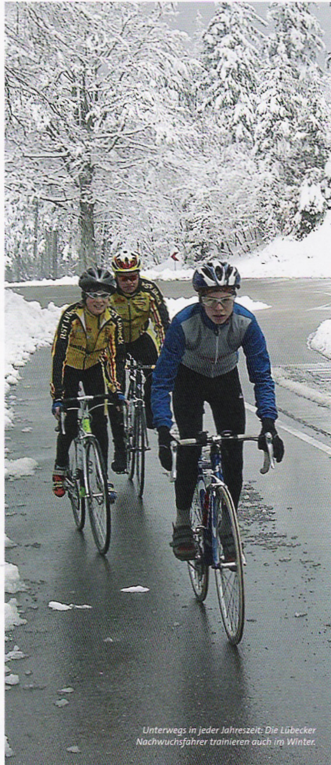
Unterwegs in jeder Jahreszeit: Die Lübecker Nachwuchsfahrer trainieren auch im Winter.